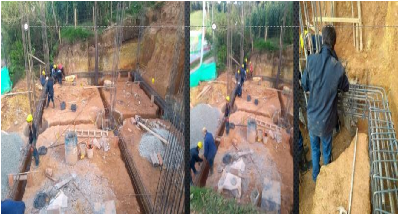
Vaciado de VIGAS DE FUNDACION Y PEDESTAÑES – sección 40 x 40 cm -- torre sur 73.70 Metros