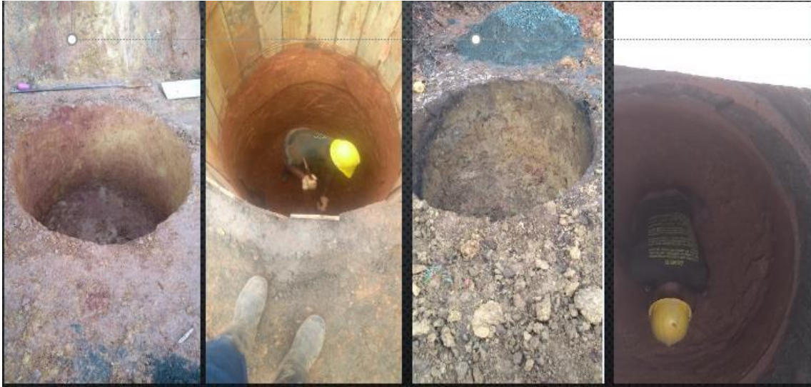
EXCAVACION MANUAL VIGAS DE FUNDACION – TORRE 1 SUR – SEMISOTANO – LOCALES - 73.70 M.L.