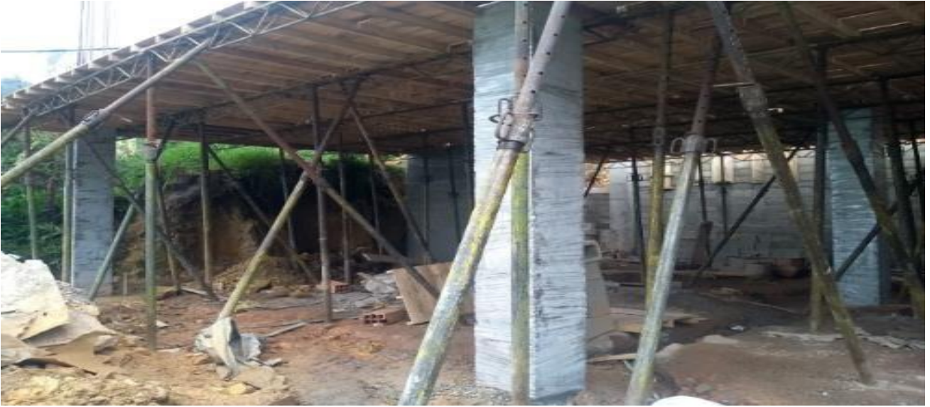
Construcción de muro de contención – muro cortina 73.70 m2